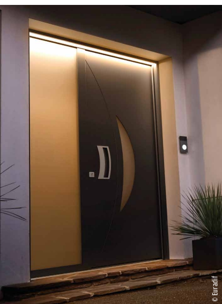
Le bandeau de Leds intégré Euraled s'installe sans percement sur le mur.