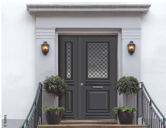
Les grilles en acier assurent à la porte une sécurité supplémentaire.

En termes de design, si la demande de produits classiques perdure, la tendance est clairement au contemporain. TBC Conseils & Innovations indiquait en mars dernier que le marché des portes d'entrée à fin 2022 affichait 61 % de portes modernes pour 39 % de basiques. « Le classique s'affiche de plus en plus à travers des moulures rapportées et des grilles décoratives, qu'elles soient en fonte d'aluminium ou en impression numérique », décrit Charles Creton,