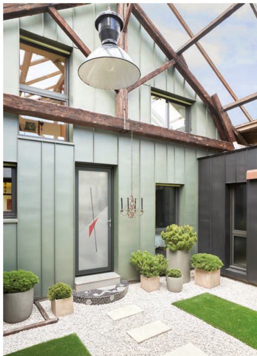
La collection grand vitrage Zénith chez Euradif rencontre un bon succès.