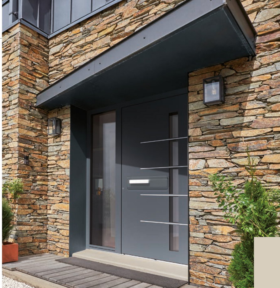
Euradif commercialisera sa nouvelle collection de portes aluminium 95 mm à l'automne 2022.