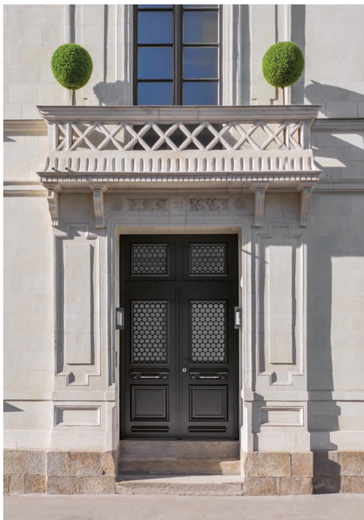
Le modèle Tradition, équipé de la nouvelle grille décorative Alva.