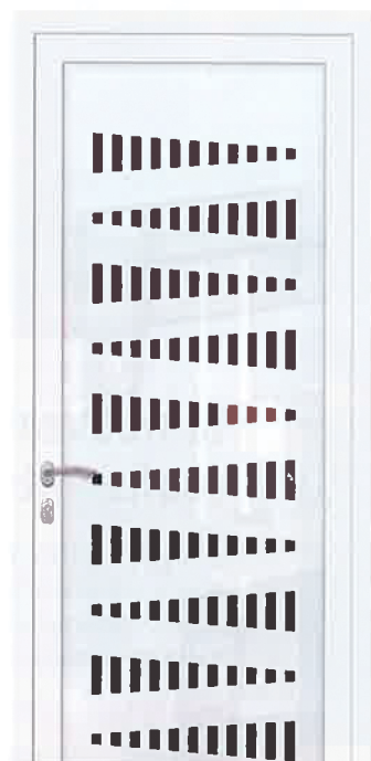
Tona, nouveau panneau de verre de la collection Vertigo d'Euradif.