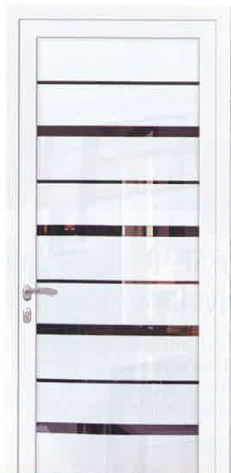
Hudson, nouveau panneau de verre de la collection Vertigo d'Euradif.