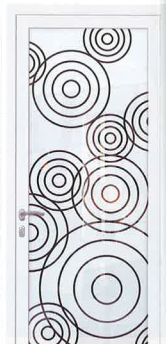
Parano, nouveau panneau de verre de la collection Vertigo d'Euradif.