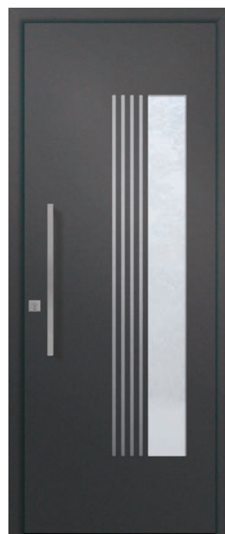
Passage décline trois nouveaux design, ici le modèle Persan.

« Les contraintes de fabrication propres au chantier sont prises en compte (dimensions, type de pose...) et la 3D s'adapte au résultat de fabrication réel. Il n'y a plus de mauvaise surprise pour le consommateur car la porte posée chez lui correspond parfaitement à ce qu'il a vu sur le configurateur. Les plans techniques propres au chantier viennent conforter les poseurs et les techniciens. Le chiffrage automatique permet au professionnel de générer son devis pour le consommateur et de passer sa commande à Euradif facilement. La deuxième étape permettra de bénéficier des avantages de la 3D directement dans Prodevis, voire d'autres logiciels de chiffrage, puis d'intégrer le passage de commande via EDI pour mettre un terme à la double saisie. »