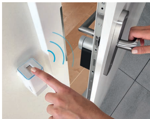
Passage peaufine son offre de gestion d'accès.