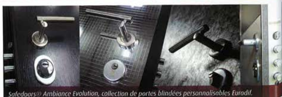
Safeddoors® Ambiance Evolution, collection de portes blindées personnalisables Euradif.

Euradif s'est équipé de 2 bancs d'essais haute performance garantissant la technicité de ses ouvrants monobloc : banc AEV et banc d'ensolèillement conformes aux normes en vigueur. Cette décision a été motivée par les nombreuses demandes de tests techniques et sécuritaires des industriels de la menuiserie, particulièrement sur le registre de l'ouvrant monobloc pour les gammes européennes de profils Alu et PVC. Les techniciens d'Euradif sont en formation constante en collaboration avec le FCBA, son partenaire essais, pour aider ses clients à intégrer ces produits sereinement. Produisant 90 000 ouvrants monoblocs et panneaux de porte/an, Euradif conforte son exigence de qualité en investissant dans ces équipements mais aussi dans l'imprimante 3D ou le logiciel de