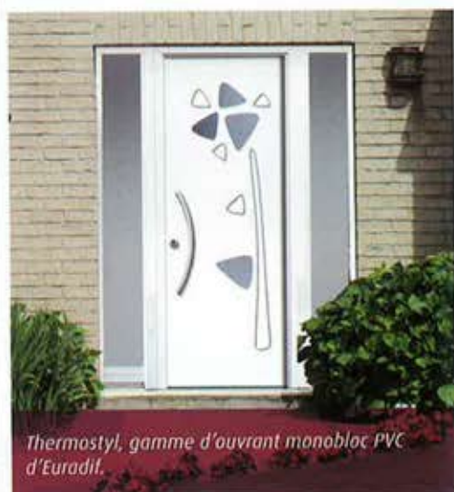
Thermostyl, gamme d'ouvrant monobloc PVC d'Euradif.