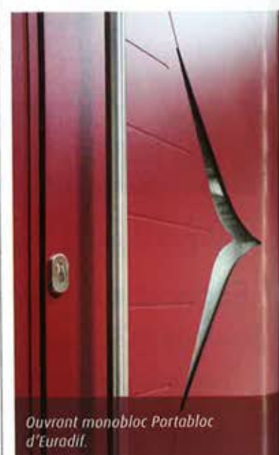
Ouvrant monobloc Portabloc d'Euradif.