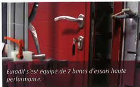
Euradif s'est équipé de 2 bancs d'essais haute performance.