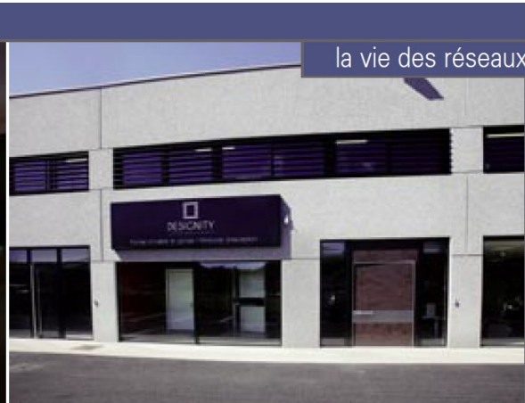
la vie des réseaux

management des réseaux sociaux... - de nombreux outils opérationnels, comme notre configurateur de portes www.configurateur-portes.fr , permettant au particulier de créer, sur son lpad, la porte idéale et de l'intégrer à sa façade parmi une large palette de matériaux et de design ».