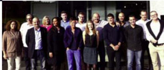
"Partenaires Euradif", un nouveau réseau déjà mobilisateur, avec 220 adhésions en 2 mois ! Une contrepartie morale plutôt que juridique

2012), s'agrandit, multiplie ses sites de production, développe des centaines de références, lance de nouvelles collections, se diversifie. La maturité et l'évolution du marché représentent un contexte porteur pour devancer les attentes et réunir les synergies, tout en affrontant