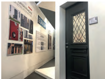
Un best-seller, le modèle SPENCER 1 avec ses moulures rapportées et sa grille RUSTICA dans le nouveau showroom d'EURADIF

Face au bouleversement de son marché, Euradif place ses salariés au centre de son dispositif : recrutement, formation, coaching, elle accompagne ses équipes vers une adaptation au marché et aux technologies de demain. Grâce à une culture managériale qui consiste à impliquer et valoriser ses équipes, alliée à une culture technique relative à la porte d'entrée monobloc, Euradif accroît les compétences de chacun et forme ses salariés à tous les niveaux. Une petite révolution qui a été possible grâce