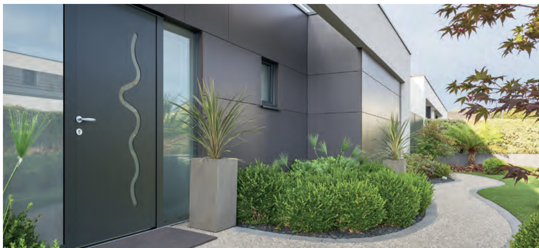
Nouveau modèle de porte d'entrée : Jonc 1 d'Euradif