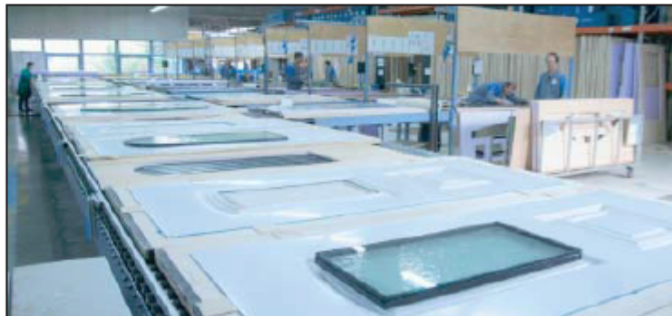
Pour satisfaire ses clients, Doors International s'est organisée pour proposer ses produits à l'unité.

► DSL. - Cette filiale, créée en 2012, est dédiée à la commercialisation de la marque Designity, qui propose exclusivement des portes blindées et intérieures d'exception. ■