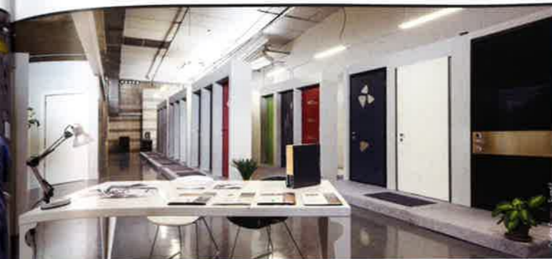
L'aménagement du showroom en 2014 expose plus de 70 portes, et reflète la diversité et la performance de l'offre Euradif dédiée à la prescription, au logement individuel et collectif, ...

... (ci-contre à droite) porte blindée Safedoors® haut de gamme Euryale wengé et (ci-contre à gauche) modèle Carmin chêne blanchi RT Doors®, le design représente également un axe majeur pour le fabricant