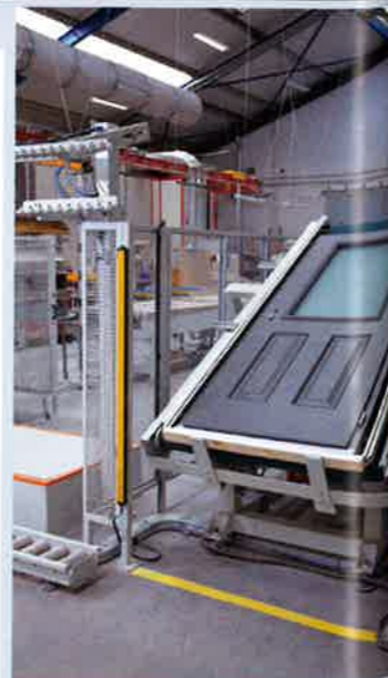
... et table basculante. Euradif engage un développement technologique de pointe et l'optimisation des conditions de travail en interne

Au cœur d'une production responsable engagée et ultra moderne, dans des ateliers réunissant un savoir-faire mul-