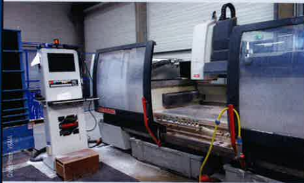
Unité de découpe du verre ultra-moderne...