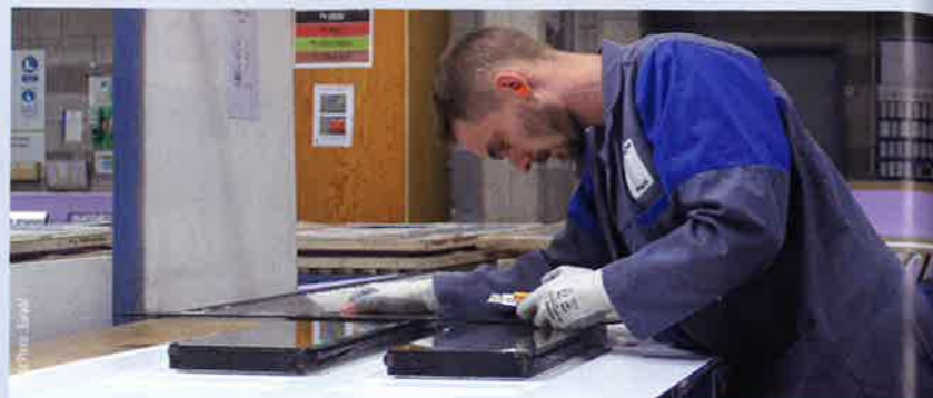
... et pose du verre sur panneau ;