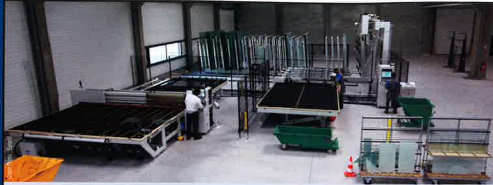
Euradif a aménagé un bâtiment de 3 000 m 2 pour notamment accueillir la nouvelle machine numérique de découpe de verre