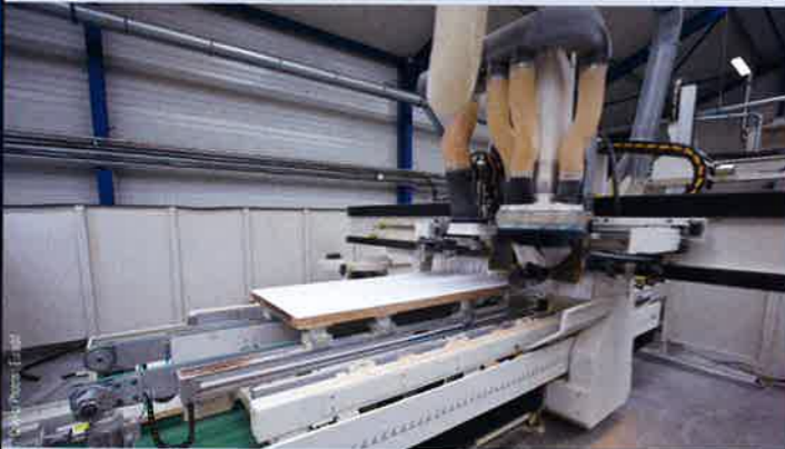
Usinage des profils ; ici, usinage des ouvrants monobloc ThermoStyl pour le PVC