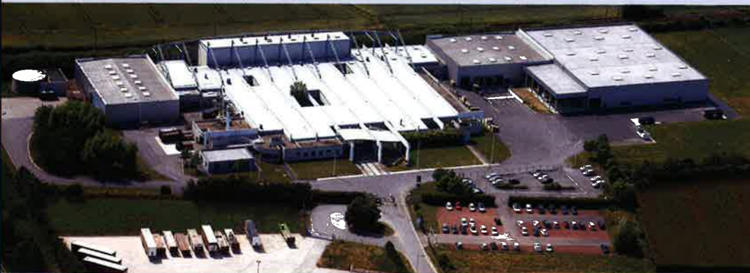
Le site de Béthune ne cesse de s'agrandir, avec aujourd'hui 17 000 m 2 couverts et de nouvelles extensions en vue