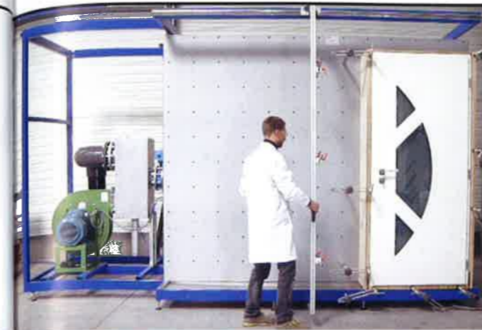
Euradif a récemment intégré un laboratoire unique en son genre avec banc AEV et banc d'ensoleillement au service de ses partenaires